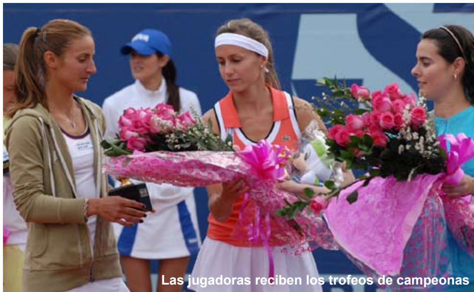
Las jugadoras reciben los trofeos de campeonas

En el segundo sus oponentes ajustaron los movimientos, respondieron con efectividad y forzaron a las campeonas a emplearse al máximo, para empatar a 6 el set y obligar el tie break definitivo; en éste realizaron espectaculares jugadas que animaron a los espectadores y que les permitieron alzarse con el título de dobles. ■